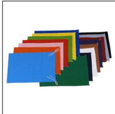
No. 15 団旗