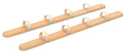
No. 5 ムカゲ競争用下駄