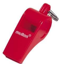
No. 23 笛