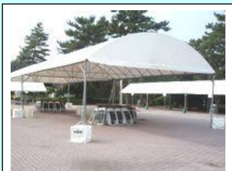
No. 29 ロンブルテント