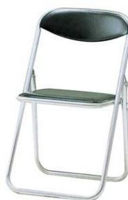
No. 28. パイプイス