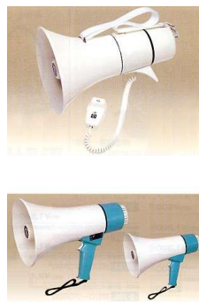
No. 24 拡声器