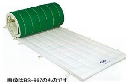
画像はBS-967のものです