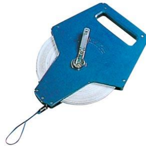
No. 34 巻尺50m