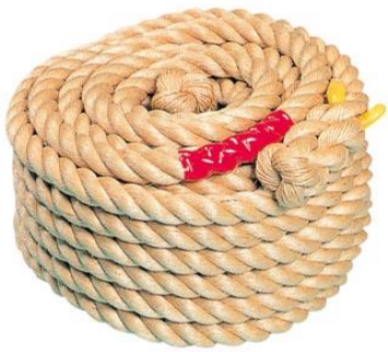
No. 3 綱引き用綱(L30m・50m)