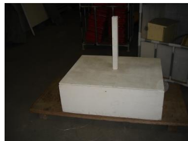
No. 12 掲揚台