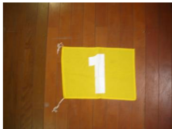
No. 9 着順旗()