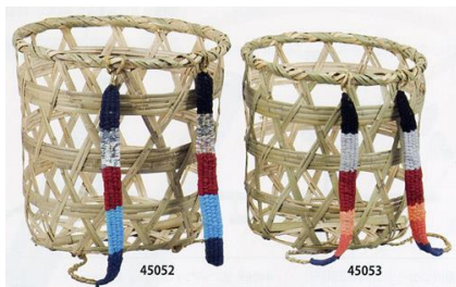
No. 17 背負い籠