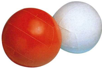
No. 1 大玉(赤、白、φ1500)