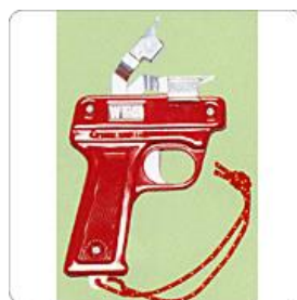
No 6 ピストル