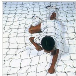
No. 11 障害物用ネット()