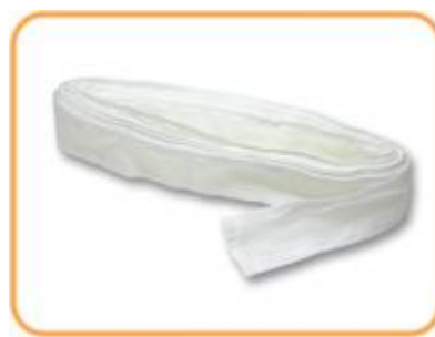
No. 22 ゴールテープ