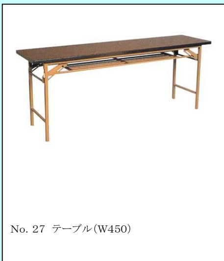
No. 27 テーブル(W450)