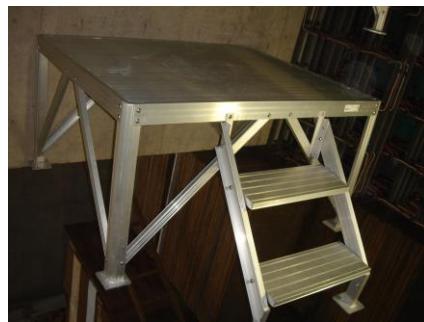
No. 4 朝礼台(1500・900)