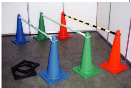
No. 21 スコッチコーン